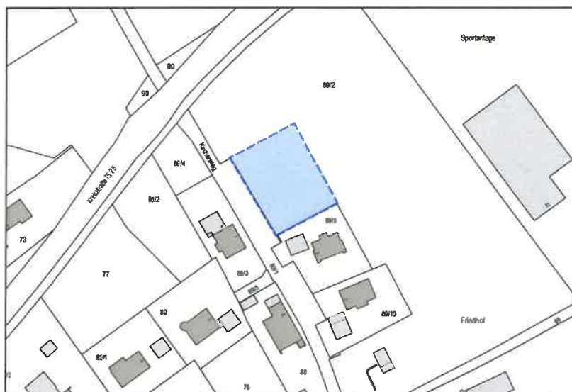
Lageplan mit Abgrenzung des Planungsbereichs

Der räumliche Geltungsbereich umfasst eine Teilfläche des Grundstücks Flurstücksnummer 89/2 der Gemarkung Lampoding. Der Geltungsbereich liegt östlich des Kirchenwegs und ergibt sich aus dem untenstehenden Lageplan.